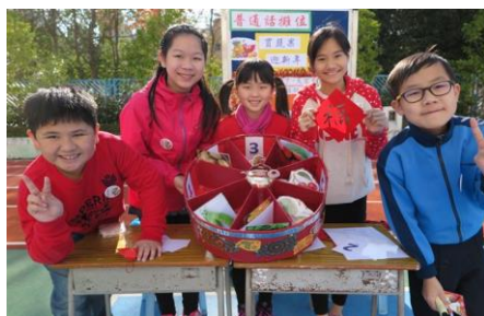
快來！我們的攤位遊戲很好玩呢！

二月五日是一年一度的中國文化日，本年度的主題為「中國飲食文化」。老師們安排了一連串既豐富，又精彩的節目，讓同學體驗中國的傳統文化，當中包括了多元化的攤位遊戲、展板、中國民間小吃及親子廚藝大比拼。同學及家長都十分投入當天的活動，校園內洋溢着一片新春氣氛，當日還有財神與大家一起歡度文化日呢！這真是一個令人愉快又熱鬧的日子呢！