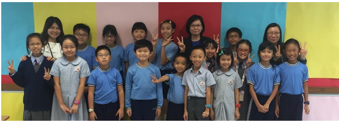
才俊飛昇基礎學員

劉校長曾在某一所學校任教英文，班上有一位插班生連 A 至 Z 也不懂，英文水平十分低，而且覺得英文很深奧，跟不上進度。於是校長便叫他每天放學後留校學習，一點也沒有放棄他。大約兩個月後，他的英文默書已經合格，校長為他的努力感到開心，現在他已成為一名英勇的警察呢！另外，校長在東華三院聯校運動會上遇到一位在高可寧小學教英文的老師，原來校長以前曾是她的英文老師，校長感到很高興，因她以前的努力是沒有白費的，能夠把知識承傳下去，是一件值得光榮的事。從訪問中，我們都感受到校長是一位真心為教育而付出的好老師，我們以你為榮呀！