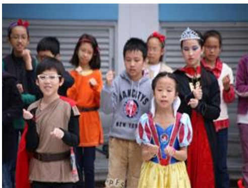
我們的表演精彩嗎？

本年度英語日的主題是 Snow White，當天同學們和老師均悉心打扮成童話故事中的人物，令大家仿如置身童話世界。同學們透過攤位遊戲、電影欣賞及小手工等活動，在輕鬆愉快的環境下一同學習英語。此外，家長義工把校園佈置得像童話王國一樣，讓同學身歷其境，感受故事中的樂趣。最後，同學們的精彩表演，把英語日的活動推向高潮！這天真令人難忘！