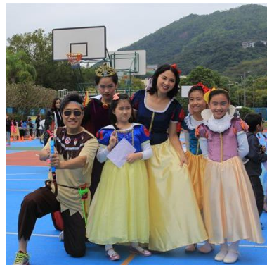
同學和老師扮演故事中的人物